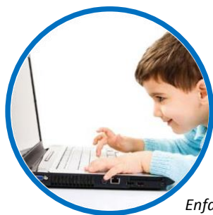
Enfant de 5 ans